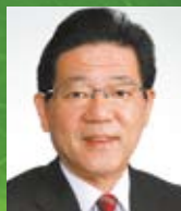
北橋 健治 北九州市長 福岡県市長会会長