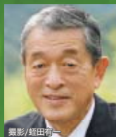
高野 孟 ジャーナリスト