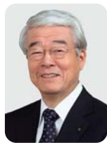
矢田 立郎 神戸市長

[ 奥山仙台市長による特別講演 ～東日本大震災で実感した地域主権改革の必要性～ ]