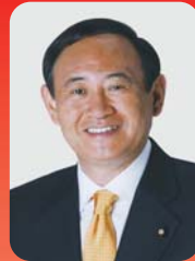
菅 義偉氏 自民党／元総務大臣 元内閣府特命担当大臣 (地方分権改革)