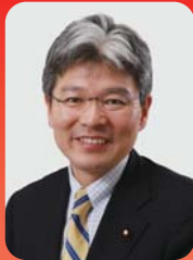
逢坂 誠二氏 民主党／前総務大臣政務官 元内閣総理大臣補佐官 元ニセコ町長