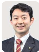
熊谷 俊人 千葉市長