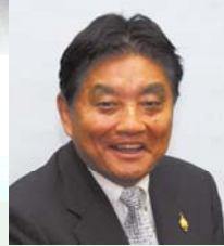
名古屋市長 河村 たかし