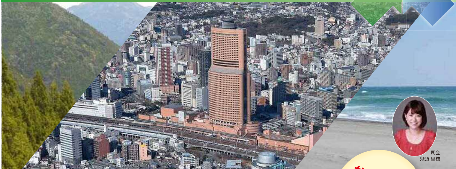
司会 鬼頭 里枝